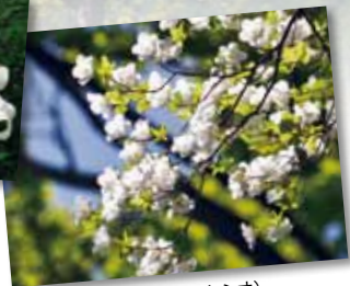
ゴヨウツツジ (別名 シロヤシオ)