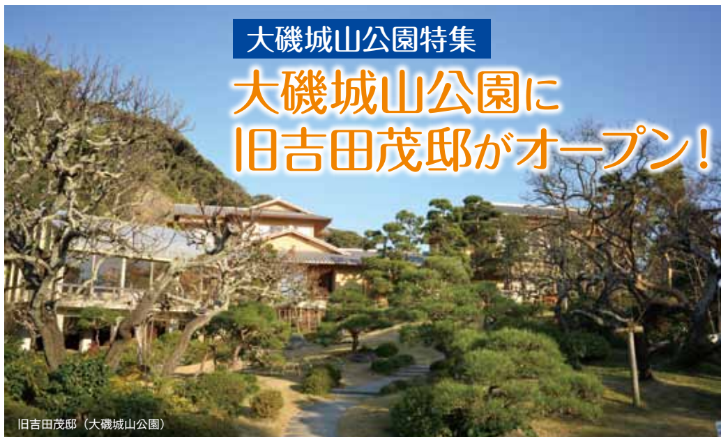
旧吉田茂邸 (大磯城山公園)