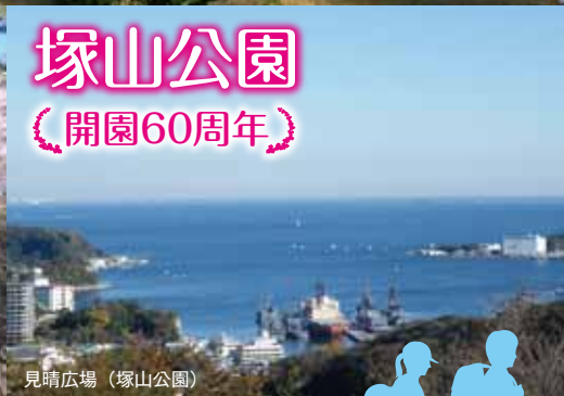
見晴広場 (塚山公園)